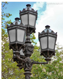
- Фонарь на площади Островского.