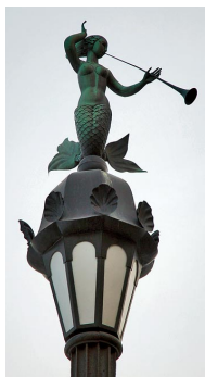
- Фонарь на Мытнинской набережной

В рамках ознакомления с темой предлагаем Вам рассмотреть фонари нашего города и придумать необычную историю об этом фонаре. Варианты некоторых фонарей представлены ниже.