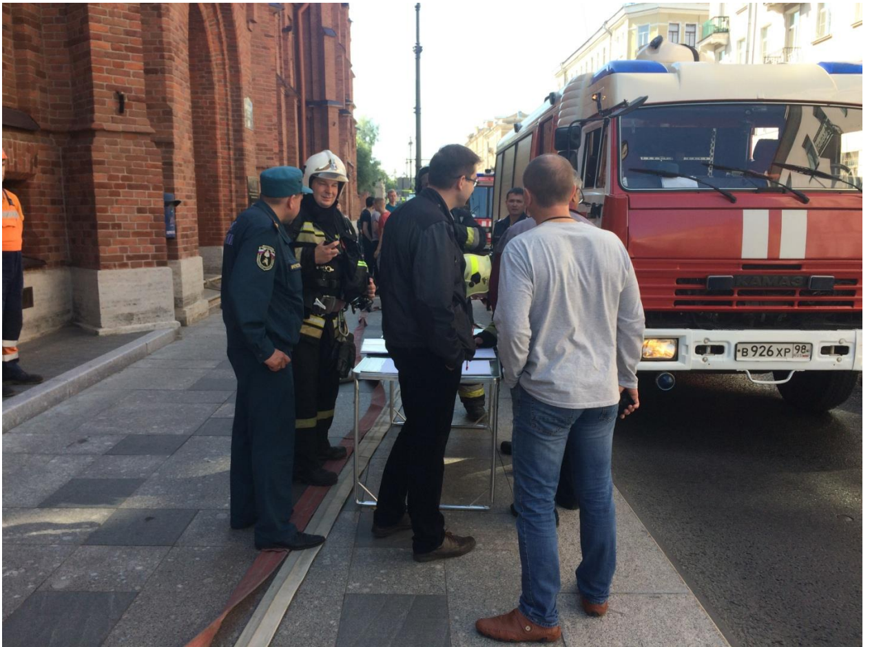
ОНДПР Центрального района 23.07.2019