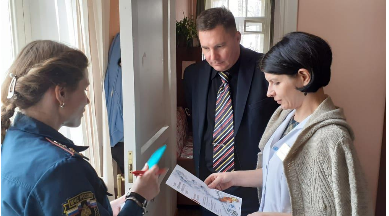
ОНДПР Центрального района 15.03.2020