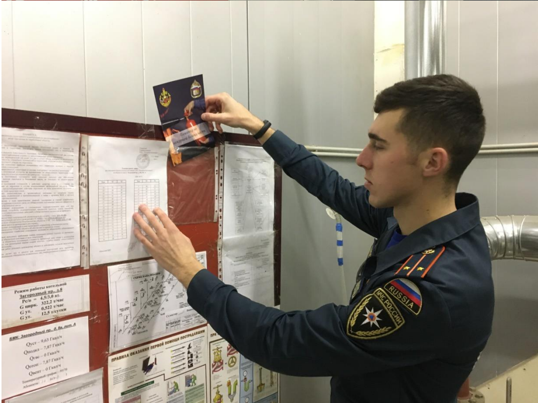
ОНДПР Центрального района 22.11.2019