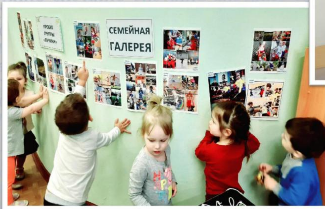
Группа раннего возраста «Лучики»