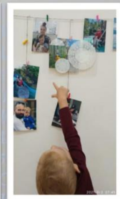
Младшая группа «Ягодки»