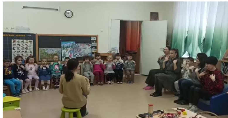
Старшая группа «Музыкальная лаборатория»