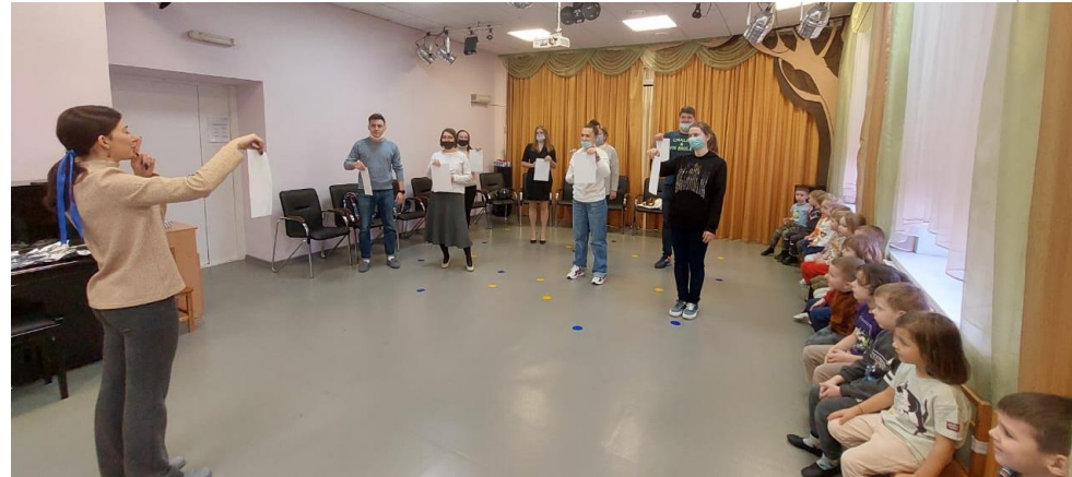
Средняя группа «Музыкальные эксперименты с бумагой»