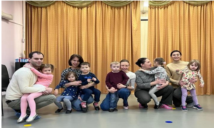
Младшая группа «Первые музыкальные праздники совместно с родителями»