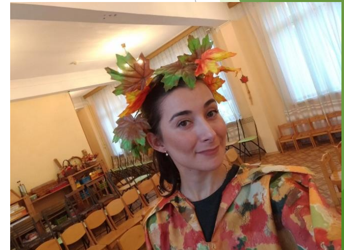
Мой первый рабочий день