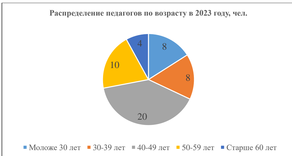
Диаграмма № 3

Анализ возрастного состава показывает, что в коллективе преобладают опытные педагоги в возрасте от 40 до 59 лет (в сумме 60%). Также высока доля специалистов в возрасте до 40 лет (в сумме 38%). Это позволяет педагогическому составу поддерживать кадровый баланс и высокий уровень обеспечения качества образования.