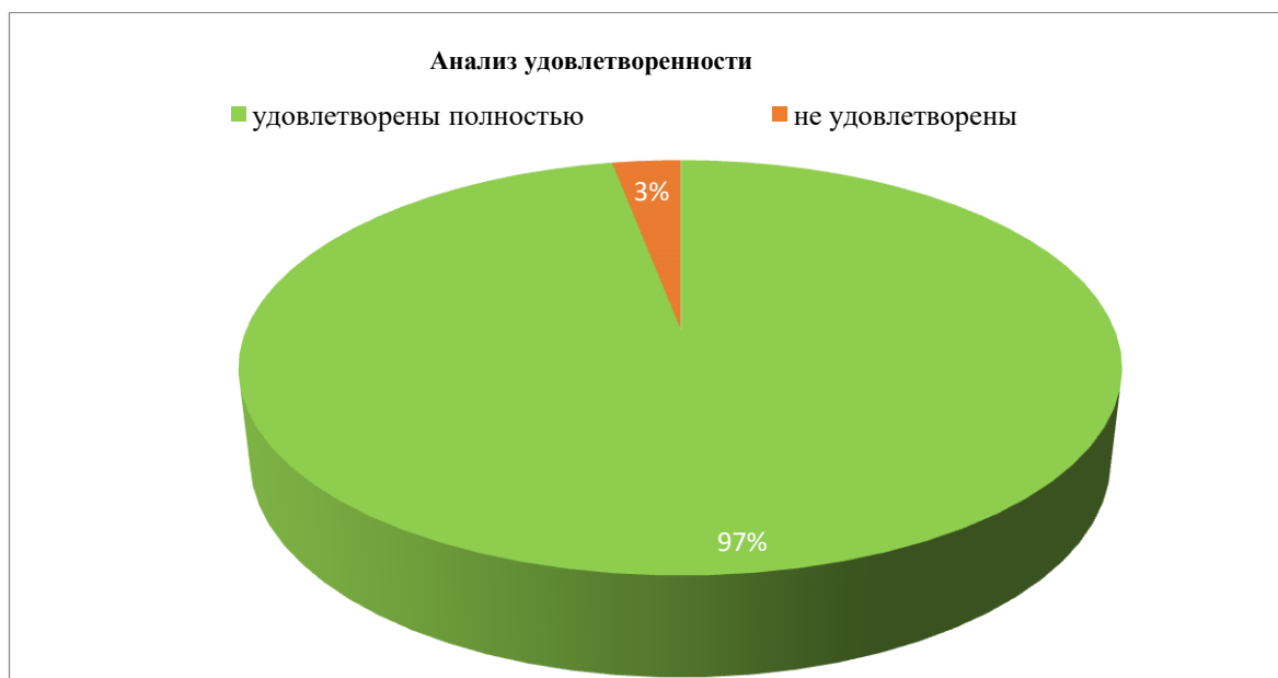
Диаграмма № 5

97% опрошенных родителей полностью довольны качеством работы педагогов;