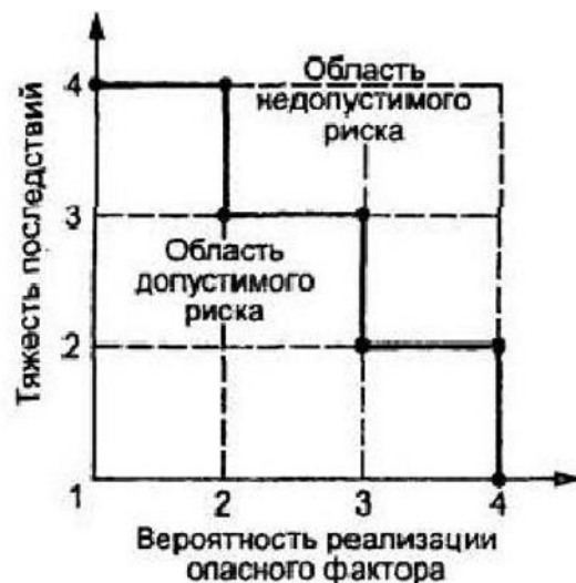
Таблица анализов риска при приготовлении и потреблении блюд.